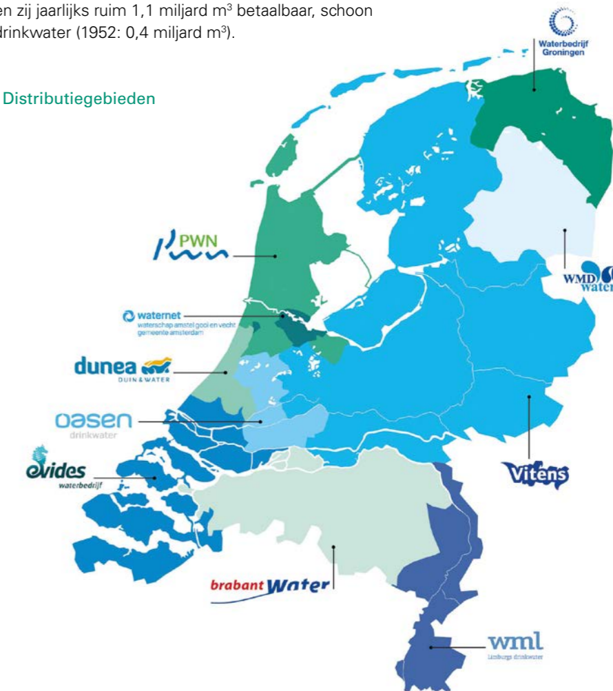
Figuur 1: Distributiegebieden

Vewin is op 18 november 1952 opgericht. Nederland telde toen 198 drinkwaterbedrijven, waarvan er 177 lid waren van de vereniging. Op dit moment kent Nederland tien drinkwaterbedrijven, die alle zijn aangesloten bij Vewin. Samen produceren zij jaarlijks ruim 1,1 miljard m 3 betaalbaar, schoon en veilig drinkwater (1952: 0,4 miljard m 3 ).